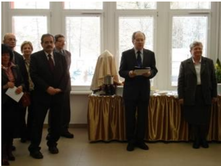
Uroczystość otwarcia LBS w budynku Radiochemii

dzisiejszego otwarcia, tak będziemy dalej ten kampus budować, wspólnie z Akademią Medyczną, wspólnie z Instytutem Farmaceutycznym, wspólnie z instytutami PAN-owskimi na terenie Ochoty, i przy akceptacji władz miasta i kraju. Ukierunkowani jesteśmy w tej inicjatywie na kontakt z gospodarką - to jest ogromnie ważne, to jest element rozliczenia inwestycji ze środków europejskich: funduszy strukturalnych i funduszy przedsiębiorczości, z których te pieniądze pochodzą. – mówił Dziekan.