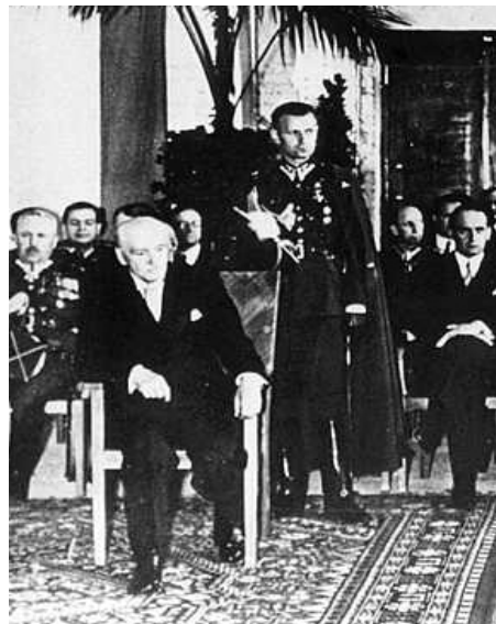
Prezydent Ignacy Mościcki otwiera Gmach Chemii Uniwersytetu im. Józefa Piłsudskiego w Warszawie

Dlatego też Ministerstwo W.R. i O.P. uznało za stosowne rozpocząć jednak rozbudowę, choćby w małym zakresie - i w tym celu pragnęło uzyskać w budżecie pewną kwotę na budowę jednego z najpilniejszych potrzeb Uniwersytetu, mianowicie gmachu chemii. Oznajmiono nam, że wstawiono do Komisji budżetowej kwotę 450.000 zł, która powoli stopniała, przechodząc przez rozmaite filtry do kwoty 100.000 zł. Ta drobna kwota dała nam już możliwość rozpoczęcia prac przedewszystkim oznaczenia miejsca na placach przeznaczonych pod rozbudowę. Ministerstwo Robót Publicznych, względnie Warszawska Dyrekcja Robót w osobie p. inż. Tomorowicza zdołała uzyskać od wojska przy interwencji prof. Michałowicza i Rektoratu zezwolenie budowy na 6 hektarach. Tam zatem ma stanać gmach chemii.